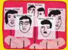
彼らはどこに? : プラカード Where are they?: Banners [作者] Violeta Morales, 1990年 作者 Violeta Morales はピノチェト政権の人権侵害を告発するアルピジェラを数多く制作しました。行方不明者の家族の運動をモチーフにした作品もそのなかに含まれます。行方不明者の顔写真のプラカードが描かれています。