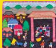
アルピジェラの作業所 布を持ち寄る Arpillera Workshop (Bringing Cloth) [作者] 不明, 1990年頃 女性たちがアルピジェラ作りのために家から布を持参しています。

“アルピジェラ”とそれに関わる動きについて、いわきの皆さんとぜひ共有したいと思っています。なぜならそれは、かつてこうしたことがあったという理解に留まらず、不安定な環境に揺れ動く私たち自身に投げかけられたメッセージとしても、深く考えさせられるものだからです。