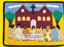
政治囚に自由を Freedom to the Political Prisoners [作者] Irma Muller, 1990年 政治囚として逮捕された家族や知人の解放を求めて街頭運動が行われています。女性たちは、このように行倉や教会など公的な建物の前でよく街頭行動を行っていました。