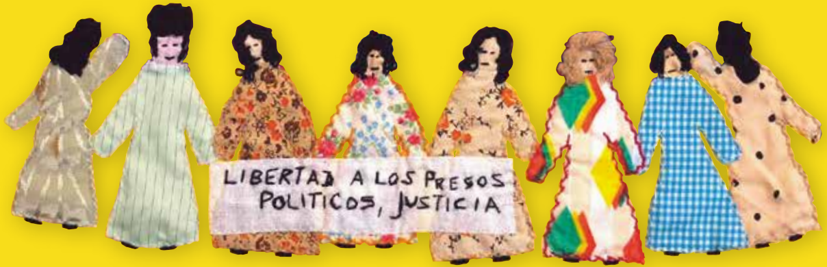
政治囚に自由を Freedom to the Political Prisoners [作者] Irma Muller, 1990年