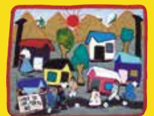
チリは一体となってノーを叫ぶ Chile Unifies to Say No [作者] L.C., 1990年頃 ピノチェト信任の国民投票に向けて、ピノチェト・ノーの運動をする人びとが描かれています。